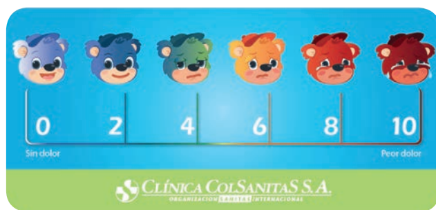
FIGURA 1. Escala Oucher para la evaluación del dolor en niños mayores de 3 años

Se recomienda emplear la Escala numérica análoga para la evaluación del dolor, en pacientes mayores de 7