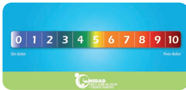
FIGURA 2. Escala numérica análoga para la evaluación del dolor en mayores de 7 años

años, de acuerdo con la Política institucional de “Hospital sin dolor” (Figura 2).