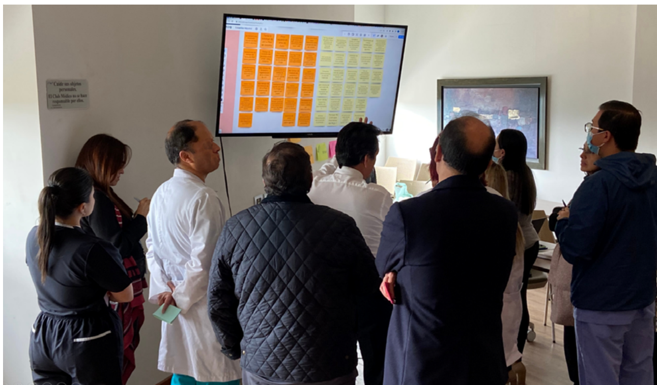
FIGURA 2. Taller de co-creación

La realización de un taller de co-creación, demostró la relevancia de la colaboración multidisciplinaria en la estructuración de los elementos de datos, está en línea con las discusiones sobre la importancia de la participación activa de los profesionales de la salud en la definición de indicadores y la adaptación de metodologías (1,11,16,21). La identificación de KPIs